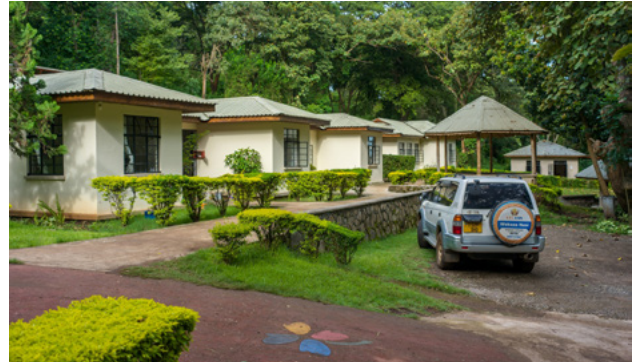
Het centrum in 2024