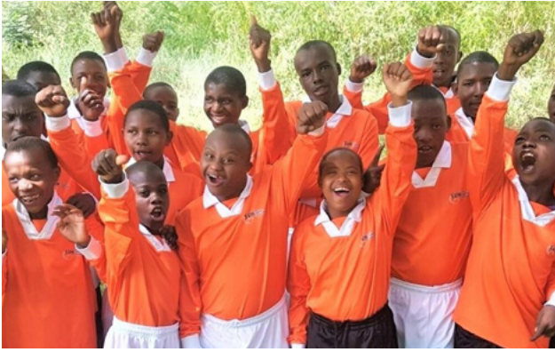
Alles voor de kinderen!