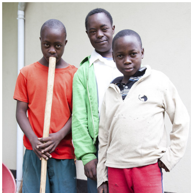
Ieder kind verdient een plaats in de gemeenschap