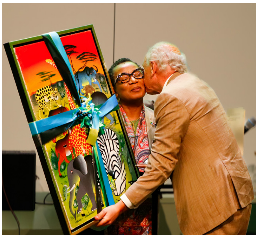
Jubileumviering op 25 september: een mijlpaal om trots op te zijn

toewijding een uniek centrum opgebouwd waar duizenden kinderen en hun families hulp en hoop hebben gevonden. Een mijlpaal om trots op te zijn.